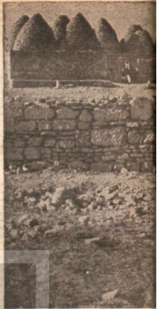
Bir Güney Anadolu köyü

3 — Ereğli Demir-Çelik Fabrikasında bir sürü yolsuzluk yapıyorlarmış. Parayı devlet veriyor ama fabrikayı kontrol edemiyorlarmış, yüz milyonlarca lira haksızca kullanılıyor.