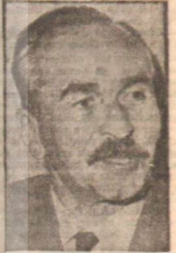
Mehmet Ali Aybar

Genel Başkan sözlerini, «Onüç mütade fırsatlı günler de bulursanız, pusulamız ve gemimiz sağlamdır» diyerek bitirdi.