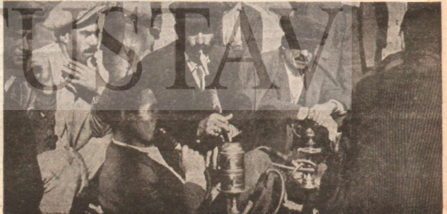
Bir kasaba kahvesinde derleyen yurttaşlar

Konya'nın Kulu ilçesinde önce kahvede sonra bir alanda partili partisiz yüzlerce vatandaşla, Cihanbeyli ilçesinde genişçe bir lokanta salonunda ve Konyada CHP il merkezinde yapılan konuşmalarda her üç yerde de Jaima ilk soru toprak reformu olmuştu. İçel hudutlarına girdikten sonraki ilk durak Mut'da ise konuşma önce ana-