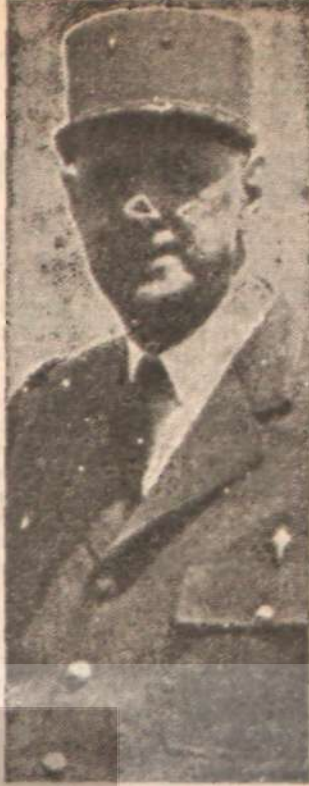
General de Gaulle Moda yaratıcı.

Amerikan hegemonyasına karşı çıkan de Gaulle, millî kurtuluş hareketlerine daha sempatik bir tutum takınmakta, Çin ile ve Doğu Avrupa ülkeleri ile münasebetlerini geliştirmektedir. Fransa, Vietnam'da, Çin'in de katılacağı milletlerarası bir konferans sonucu, tarafsızlaşmaya gidilmesine taraftardır. Kongo'da «Brakonz, Kongolular düşe kalka kendi meselelerini çözümler» görüşünü savunmaktadır. Böylece kapitalist bir ülke, siyasal ve ekonomik rejimlerine bakmaksızın, az gelişmiş ülkelerde, Amerikan emperyalizmine karşı bir rol oynama çabası içindedir. Emperyalist cepheye bulunan bir ülkenin, bu yoldaki çabaları elbette ki belli hudutları aşamaz. Fakat General de Gaulle'in Amerikaya karşı Fransanın bağımsızlığını sağla-