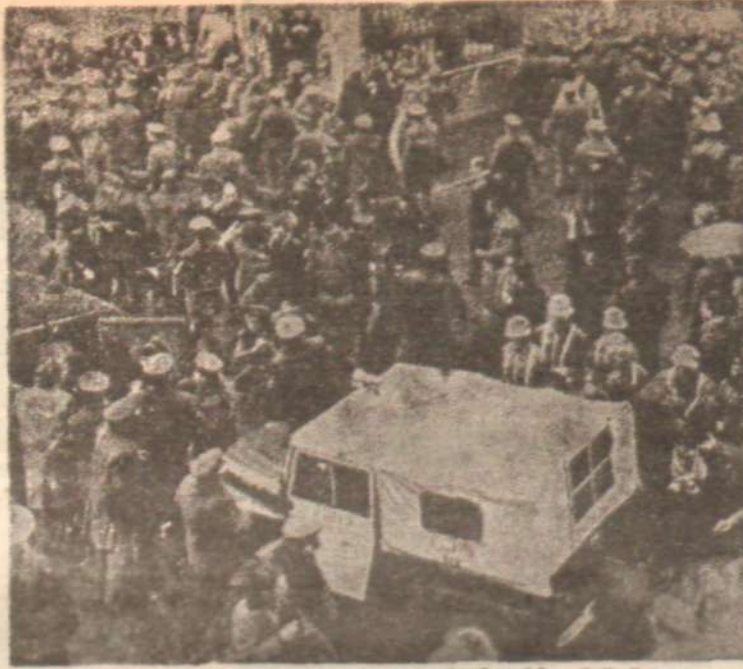
TIP toplantısında çıkarılan olaylardan bir görünüş Cam - çerçeve taşıyıcı fatihleri..

İkinci hücumları da püskürtülen fatihler, «Mareşalin cenazesinde bulunan milliyetçi gençler, bu bînavı zanttedelim» nâ-ularıyla üçüncü defa taarruza geçtiler. Fakat bu hücum da binanın dış duvarları önünde son buldu. Fatihler, bu taarruza patates ve çürük yumurta kullandılar. Ama